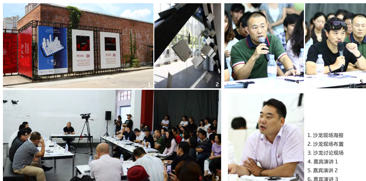
1. 沙龙现场海报 2. 沙龙现场布置 3. 沙龙讨论现场 4. 嘉宾演讲 1 5. 嘉宾演讲 2 6. 嘉宾演讲 3

This paper, by resorting to the professional experience of foreign architectural firms and integrating the background analysis of China's urban construction and the status quo of design market, proposed that it's compelling for the architectural design industries to take to professionalism in the future. Taking the firm's design philosophy, technical capabilities and performance characteristics into full consideration, Shanghai Bingren Architectural Firm asserts its position of becoming a professional and creative architectural body; In terms of specific operational work, the focus will be laid on the pre-project design creativity and later-stage completion quality control, equaling to the beginning and end of the design work.